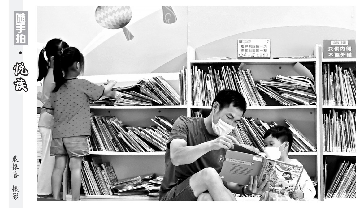
随手拍·悦读

“一辈子做老师，一辈子学做老师”，于漪老师早就给了我们答案。尽管随着岁月的磨砺，我们看起来老练成熟了，但实际上仍然会遇到新的问题，产生新的恐慌。因此，我们需要有勇气，在教学上心怀希望，如同初出茅庐的新手一般，继续去摸索，去思考，去修正，去改变，以轻盈的心态，相遇蛰伏的自我潜能，畅通教育智慧。新的学期，勇气，涌起。