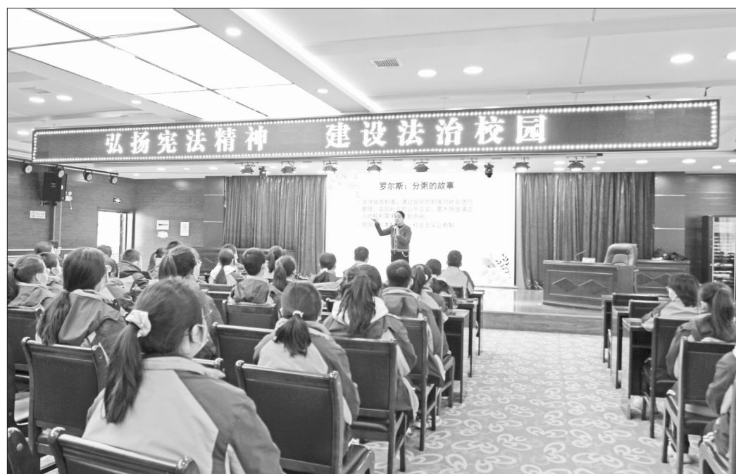
▲为增强学生宪法意识，弘扬宪法精神，全面推进依法治校、依法治教，12月2日，陕西省咸阳市秦都区天王学校举办“12·4”国家宪法日法治报告会。图为咸阳师范学院王薇教授为初一、初二学生作法治专题报告。李博 张娟情 摄影报道

我国现行宪法是中华人民共和国的第四部宪法，于1982年12月4日由第五届全国人大第五次会议正式通过并公布施行。这部宪法分别在1988年、1993年、1999年、2004年和2018