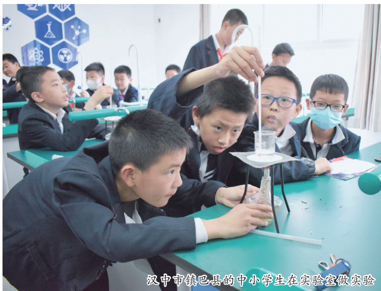
汉中市镇巴县的中小学生在实验室做实验

2022年9月,陕西省汉中市汉台区城东小学如期开学,这所新建投用的学校迎来了第一批983名新生,解了周边学校班额大的“燃眉之急”。