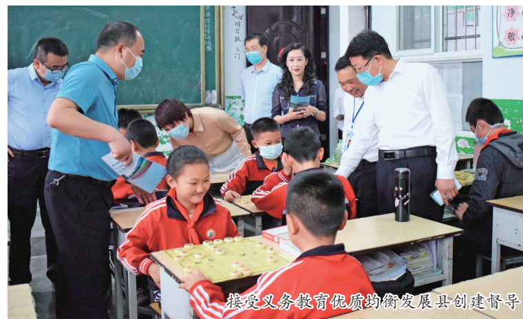
接受义务教育优质均衡发展县创建督导