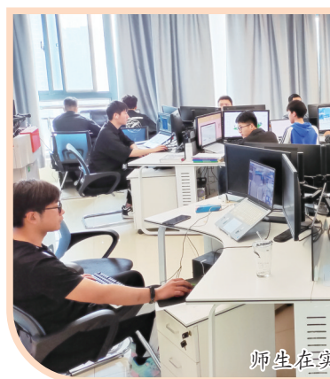
师生在实训室上课