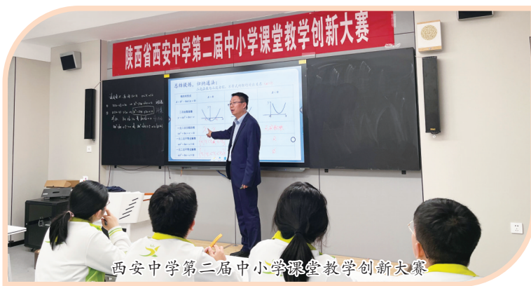
西安中学第二届中小学课堂教学创新大赛