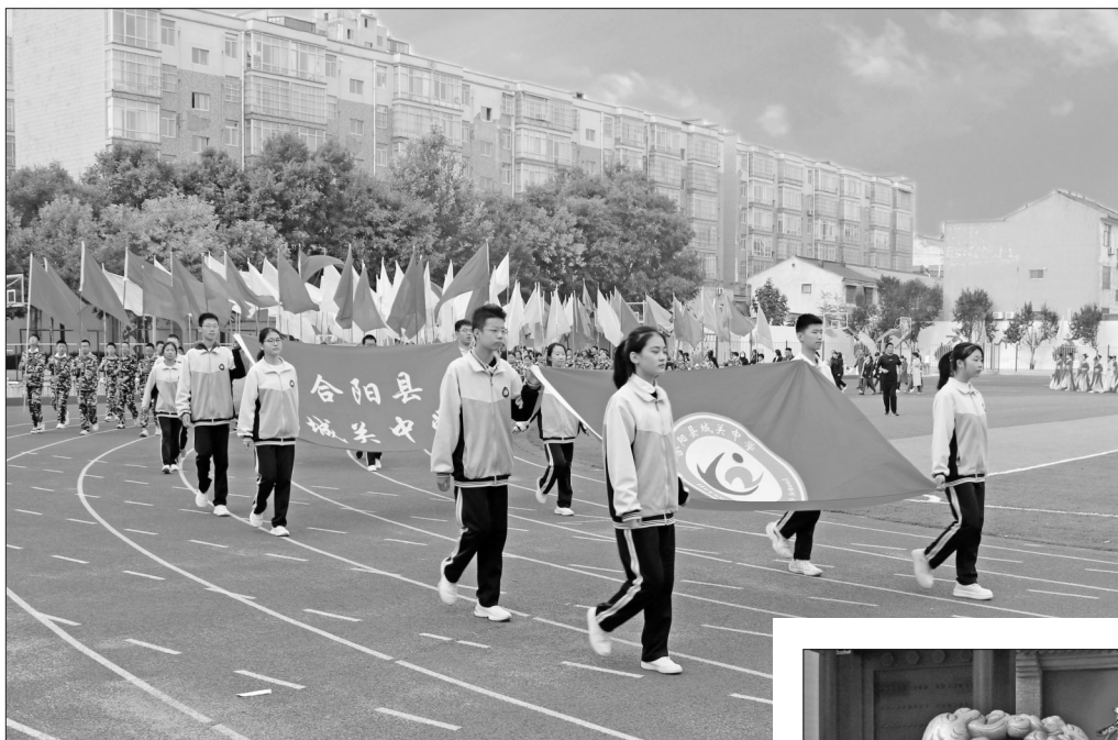
为了丰富校园文化生活，增强学生体质，培养拼搏进取、团结协作的体育精神，10月11日，陕西省渭南市合阳县城关中学举行了2023年秋季田径运动会。

(作者分别系西安交通大学中国西部高等教育评估中心/高等教育研究所博士，陕西省教育厅教师工作处副处长)