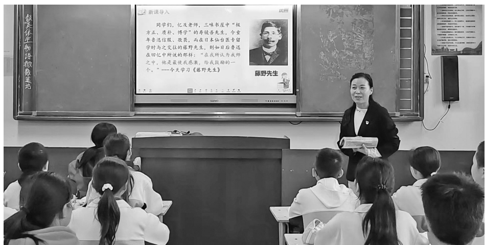
▲10月16日至20日,陕西省渭南市合阳县城关中学开展了“聚焦课堂 引领教学”党员教师示范课活动。三个支部共选送10名业务能力强、能够起到示范引领作用的省市县教学能手、教学新秀等党员教师承担授课任务。活动旨在引领广大教师在研究中沉淀、在学习中

会议期间,还举行了东北“三省一区”基础教育协作联盟成立仪式,签署了东北“三省一区”基础教育研训协作联盟框架协议。以上据《辽宁日报》。