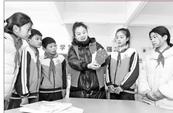
▼近日，山东省枣庄市山亭区水泉镇中心小学开展“党史教育进课堂”主题活动。因为教师给学生讲解党史知识。