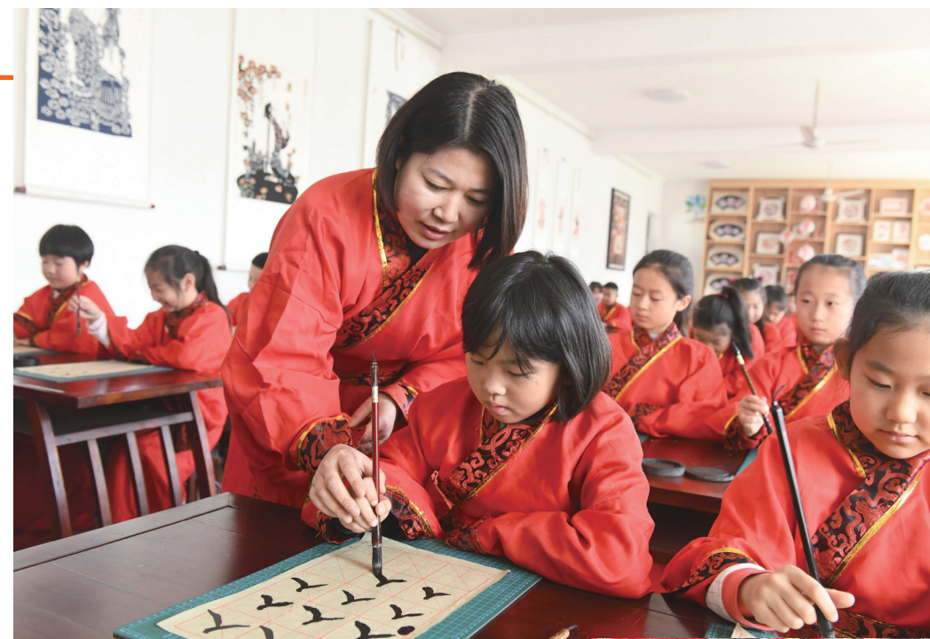
3月11日,在河北省石家庄新乐市实验小学举行的开笔礼仪式上,老师在指导学生用毛笔书写“人”字。当日,该校举办丰富多彩的民俗活动,喜迎“二月二”龙抬头。

怀进鹏说,今年在推进国家智慧教育平台建设方面,将选择一些应用急需、条件具备的地方来建设示范应用平台,同时向中西部、边远地区加大国家资源整合力度,从而更好因材施教,提高学校治理能力。