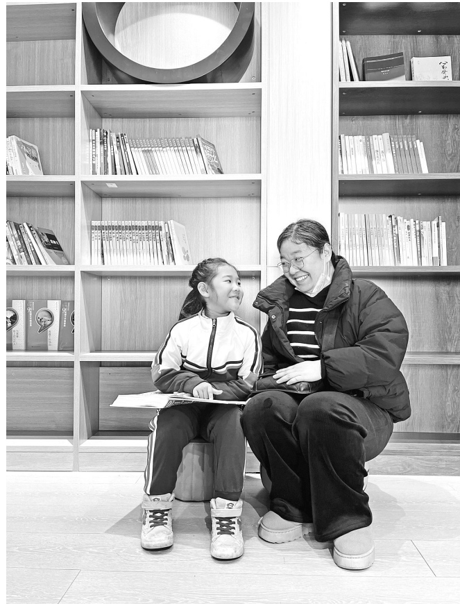
辽宁省铁岭市调兵山市有了自己的金税城市书房。一年级的的小朋友和妈妈一起来书房打卡,共享幸福的亲子阅读时光。